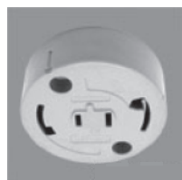
丸型引掛 シーリングボディ