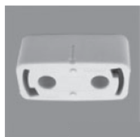
角型引掛 シーリングボディ

下図のようなアダプターが天井に設置されていれば取付が可能です。 アダプターが天井に確実に取り付けられていることをお確かめください。